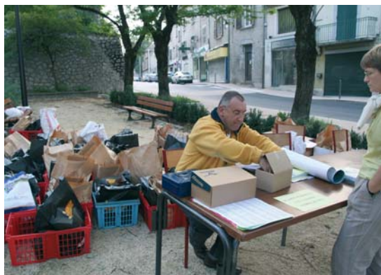
Inscriptions des participants à la Prise de la Bastille.

recherche de sponsors pour la montée 2008. Même si je quitte le club en janvier, je resterai pour finir ce que j'ai entrepris, je ne peux pas laisser mon travail inachevé. " Jean-Pierre Vinault ne nous abandonnera pas totalement. Habitant La Tronche, il risque fort de se montrer encore au cours d'une manifestation sportive.