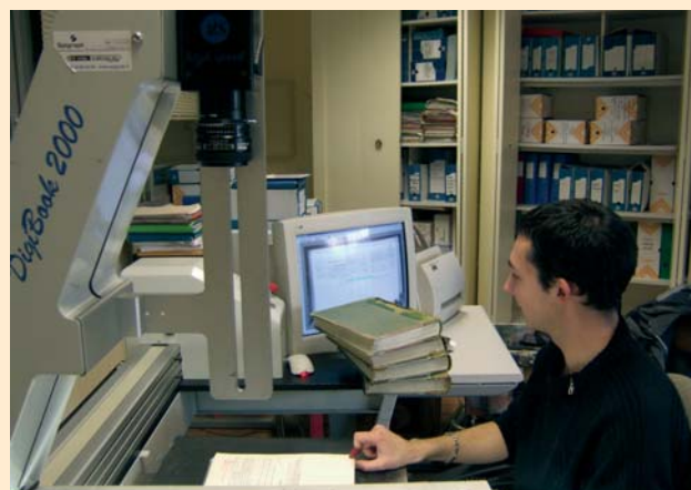
La numérisation des registres d'état-civil a duré plusieurs mois, elle apportera sécurité juridique et meilleure ergonomie au quotidien.

Il a donc été fortement sollicité en 2007 et le sera à nouveau en 2008 pour les élections municipales et cantonales des 9 et 16 mars prochain. La préparation matérielle, la constitution et la mise en place des quatre bureaux de vote, la validation de la liste électorale, l'inscription des jeunes atteignant 18 ans la veille du scrutin ou entre les deux tours : les missions ne manquent pas. S'y ajoutent la présence des agents le jour du scrutin, la tenue des procès-verbaux et une grande vigilance de tous les instants.