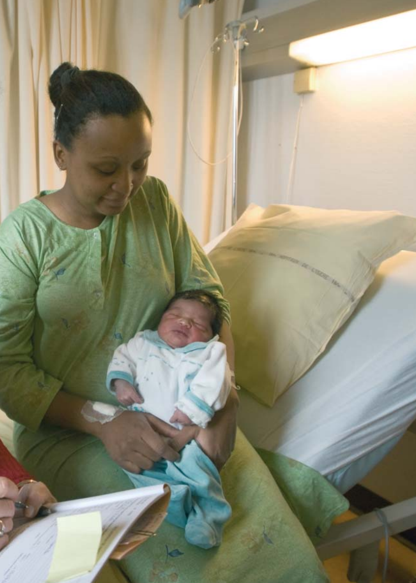
Des surveillances depuis la veille, et éventuellement établir avec la maman la déclaration de naissance.