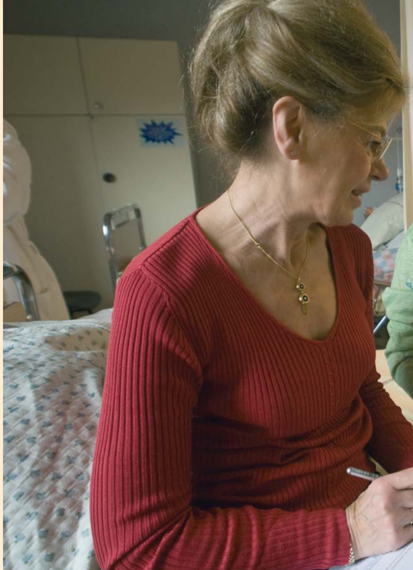
Chaque matin, un agent de l'état-civil se rend à la maternité de l'hôpital pour enregistrer les naissances.