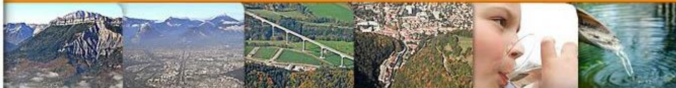
SCHÉMA DE COHÉRENCE TERRITORIALE DE LA RÉGION URBAINE DE GRENOBLE

SCHÉMA DE COHÉRENCE TERRITORIALE DE LA RÉGION URBAINE DE GRENOBLE SCoT 2030